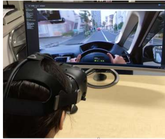
ハザード知覚検査

断念した。結果、360°カメラで撮影した動画とHPPを利用し、同乗者の話声やテレビからの音声など外乱刺激を加えるシナリオを15場面用意し、説明箇所も踏まえて合計15分程度からなるハザード知覚検査のプロトタイプを作成した。対象者は、HMDに映し出される運転場面（1設問約15秒ほど）を視聴し、その後20秒以内にできるだけ多くハザード（危険と思われる箇所）を口頭で指摘するものとした。