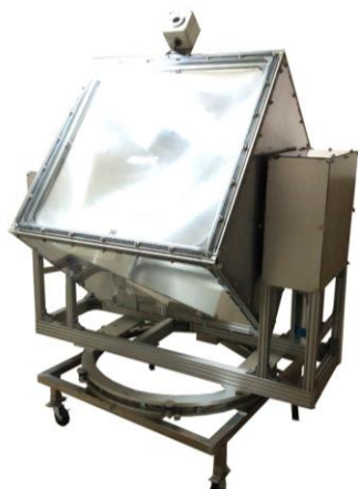
図 2. 1 m 2 級のフレネルレンズを搭載した、太陽励起レーザーシステム（外観）

更に、前述の通り、従来の過剰な熱負荷を下げるため、1 m 2 級のフレネルレンズを搭載した、太陽光励起レーザーのための新しい太陽追尾装置を作成し、フレネルレンズの焦点付近に太陽光キャビティや計測器等を取り付ける部分を付けて太陽光励起レーザーシステムとした。追尾精度は正確に測定出来ないが、計算上は上記プロトタイプと比較して誤差は1/10以下となる。作成した太陽光励起レーザーシステムの外観を図2に示す。