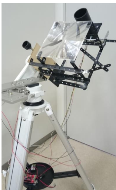
図 1. 25cm×25cm のフレネルレンズを搭載した太陽追尾装置プロトタイプ

更に、前述の通り、従来の過剰な熱負荷を下げるため、1 m 2 級のフレネルレンズを搭載した、太陽光励起レーザーのための新しい太陽追尾装置を作成し、フレネルレンズの焦点付近に太陽光キャビティや計測器等を取り付ける部分を付けて太陽光励起レーザーシステムとした。追尾精度は正確に測定出来ないが、計算上は上記プロトタイプと比較して誤差は1/10以下となる。作成した太陽光励起レーザーシステムの外観を図2に示す。